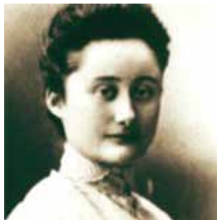
Die junge Elisabeth v. Thadden

Elisabeth v. Thadden wurde 1890 in Mohrungen/Ostpommern geboren, wo ihr Vater Landrat war. 1905 zog die Familie auf das Gut Trieglaff in Pommern. Als ältestes von fünf Kindern übernahm sie nach dem Tod der Mutter mit 19 Jahren die Leitung des Guts. Sie war kräftig, vital, voller Ideen und ein praktischer Mensch. Manch einer empfand sie auch als herrschsüchtig und als eine Jugendliche, die das Personal auf dem Gutshof herumkommandierte. Zugleich war sie sehr sozial eingestellt und holte Kinder aus dem ärmsten Teil Berlins nach Trieglaff, damit diese sich „in frischer Landluft erholen und satt essen konnten“.