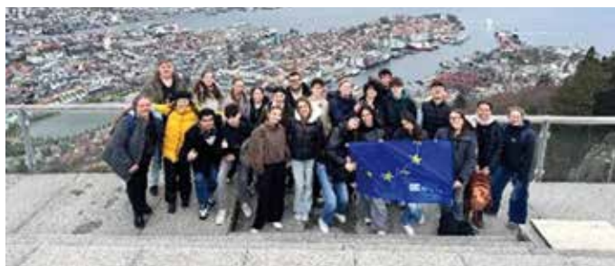
Austausch mit Norwegen. Gruppenfoto in Bergen

Ein weiterer besonderer Bereich ist die kulturelle Bildung außerhalb des Unterrichts: In der Theater-AG erleben die Schülerinnen und Schüler diese auf hohem Niveau und sammeln wertvolle Bühnenerfahrungen. Durch kreative Inszenierungen und Auftritte – unter anderem in München im Museum Fünf Kontinente.