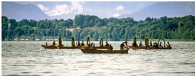
Boote vom See kommend