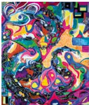
Ein Kaleidoskop unterschiedlicher Ausdrucksformen

Akademie für Politische Bildung, Buchensee 1, 82327 Tutzing