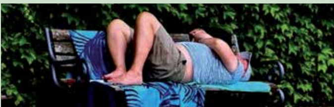
Eine Liegebänkler braucht viel Platz

Im Biergarten, da ist die Welt noch in Ordnung. Da wird gesessen. Und zwar ordentlich: Aufrecht, die Maß vor sich, Blick geradeaus oder zum Nachbarn – aber sicher nicht waagrecht wie ein gestrandeter Wal. Auf die Bierbank legt sich keiner. Noch nicht. Und wenn doch, dann gäb's vermutlich schneller einen Anschiss als ein leeres Glas. „Des g'hört si aa so“, sagt der Spezl und nimmt einen Schluck. „Eigentlich“, sagt der Tratzinger und zückt einen Kugelschreiber, „brauchats a Schuidl.“ – „A Vabotsschuidl?“ fragt der Spezl. „Fei scho!“ Und dann entwerfen sie's: Ein roter Kreis. Durchgestrichene Liegefigur. Vielleicht mit einem kleinen Schnarchzeichen drüber, damit's auch der Letzte versteht. Darunter in sauberem Amtsdeutsch: „Auf den Parkbänken liegen verboten!“ Und drunter in bayerischer Übersetzung: „Hock di hi, du Grattler!“ Sie nicken zufrieden. Trinken weiter. Im Sitzen. So wie sich's gehört.