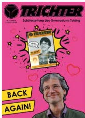
AN / St. Flierl

Seit wann es den TRICHTER gibt, lässt sich nicht mehr genau ermitteln, mindestens jedoch seit den 60iger Jahren. Fest steht jedoch, dass er aktuell leider „pausiert“. Es gibt aber initiative Kräfte, die die Schülerzeitung des Tutzinger Gymnasiums zu mindest zwischenzeitlich wieder aufleben ließen. Wir haben bei einstigen und aktuellen Jungredakteuren nachgefragt: Wie war das damals, wie ist es heute?