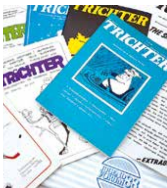
Alte Trichter-Hefte mit Mc Turtle und ein neues Cover