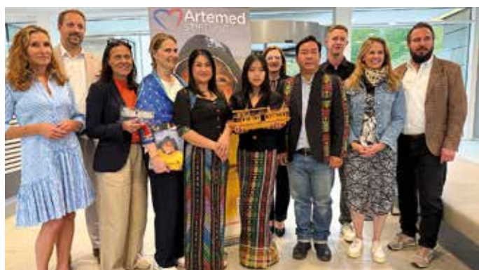
Der burmesische Abend der Artemed Stiftung mit Gästen