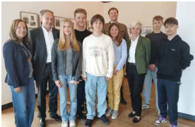
Teilnehmer der Gedenkveranstaltung im Ortsmuseum