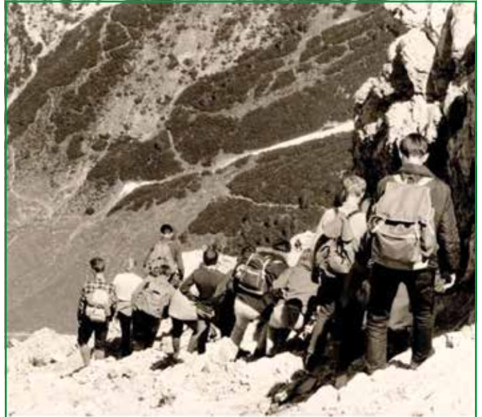
Spannender Wandertag anno 1967 am Gymnasium Tutzing

Einen ebenso spannenden und erlebnisreichen Juni wünschen Ihnen Ihre TN