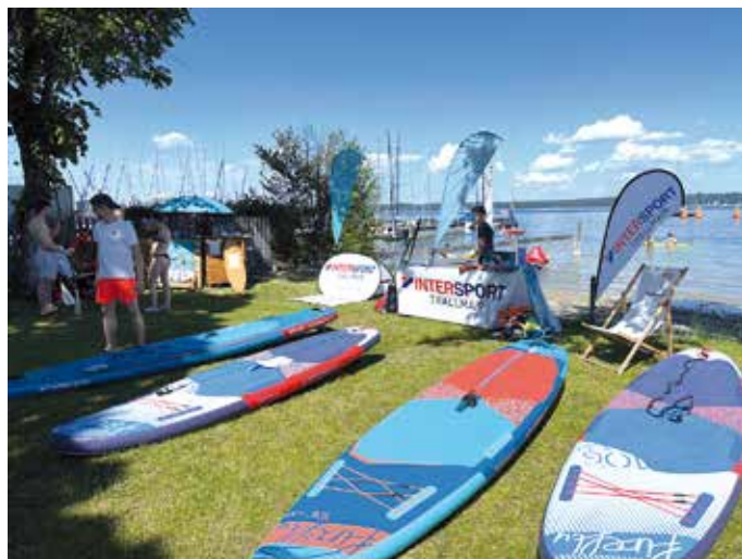
Testmöglichkeiten im Südbad