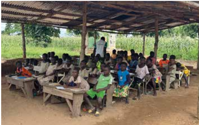
Ein Klassenzimmer in Togo