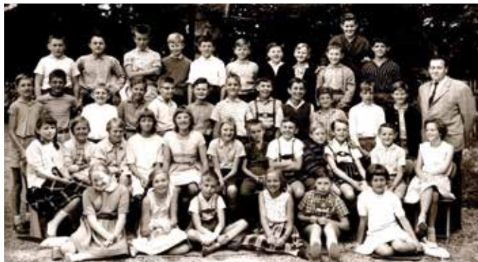
Sexta 1960 – mit über 40 Schülern keine Seltenheit!

Das Gymnasium Tutzing blickt auf eine lange und ereignisreiche Geschichte zurück.