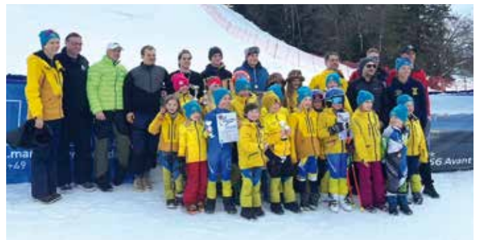
Kreiscup des TSV Tutzing

Außergewöhnlicher Winter mit großen Erfolgen und ganz viel Teamgeist