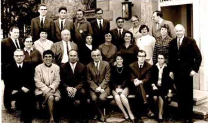
Lehrerkollegium 1962 und heute