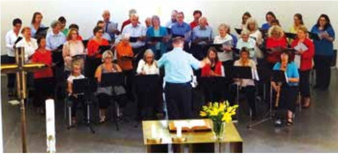
Der evangelische Kirchenchor

„Wo man singt, da lass Dich nieder“, ein passender Einstieg für unser neues Heft mit dem Titel „Singendes Tutzing – Freude am Gesang“, hat doch in unserem Ort der Gesang und das Singen eine wunderbare Tradition.