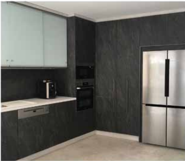
Designbeispiel - Arbeitsplatte auf Wunsch höhenverstellbar