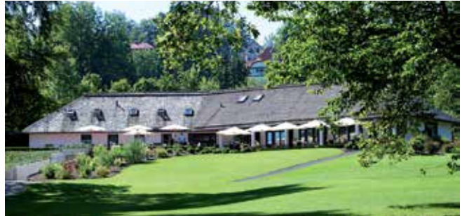
Golf-Club Feldafing Clubhaus

Die Ursprünge reichen bis ins Jahr 1852 zurück: König Maximilian II. beauftragte den Gartenarchitekten Peter Joseph Lenné mit der Planung einer Schlossanlage samt Park. Zwar wurde das Projekt unter Ludwig II. nicht vollendet, doch der Park bildete später die Grundlage für den heutigen Golfplatz.