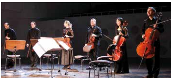
Das freie Ensemble Dresden interpretiert Schubert und Tschaikowski

Am Sonntag, den 10.5.2026 um 18 Uhr erwartet die Zuhörer beim 4. Schlosskonzert dieser Saison ein großformatiger Streichersound mit zwei herausragenden Werken der Kammermusik: