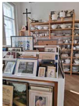
Lädt zum Stöbern ein- der Caritas Trödelladen