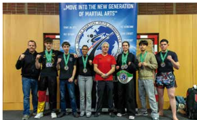
Erste Turniere- erste Plätze: Die Tutzinger Kickboxer