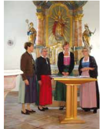
...und das Tutzinger Kleeblatt