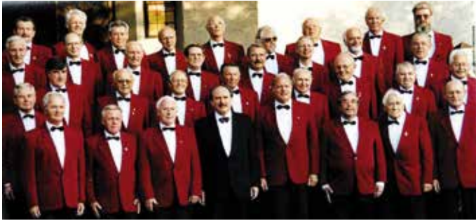
Der Liederkranz bei seiner 125-Jahrfeier...